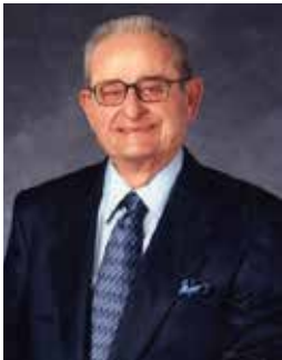
Άρχων Άλεξ Γ. Σπανός

Πρώην Διευθυντής Επικοινωνίας του Λευκού Οίκου και παρουσιαστής ειδήσεων, ABC