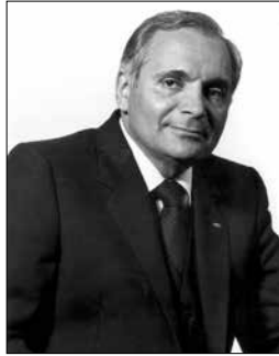
Άρχων Μιχαήλ Μπιλιράκης

Πρωτοπόρος του κινηματογράφου και Πρόεδρος της 20th Century Fox