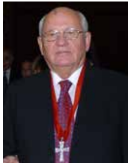
Άρχων Μιχαήλ Γκορμπατσόφ