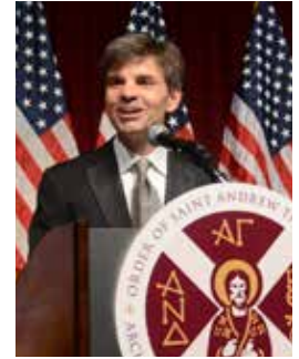
Άρχων Γεώργιος Στεφανόπουλος

Πρώην Διευθυντής Επικοινωνίας του Λευκού Οίκου και παρουσιαστής ειδήσεων, ABC