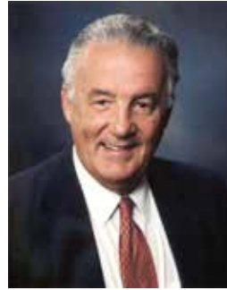
Άρχωντος Παύλος Σ. Σαρμπάνης

Μέλος της Βουλής των Αντιπροσώπων των ΗΠΑ