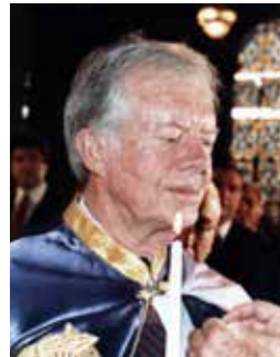
Ο Άρχων Πρόεδρος Jimmy Carter